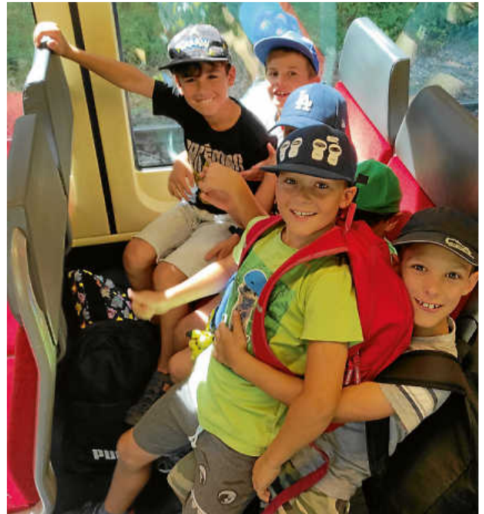
Wie viele Kinder passen auf den Doppelsitz?

Am 08.08.2024 waren wir mit 9 Kindern im Zoo in Karlsruhe. Um 9.45 Uhr sind wir mit dem Bus nach Bruchsal gefahren, um dann mit der Bahn weiter zum Hauptbahnhof nach Karlsruhe zu fahren.