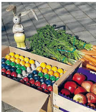
Ostern im St. Franziskus