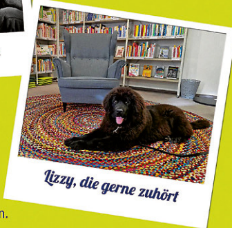
Lizzy, die gerne zuhört

Erzählwürfel, Bildkärtchen, Gegenstände und vieles mehr laden zum gemeinsamen Erzählen von Erlebnissen, Erinnerungen und Geschichten ein.