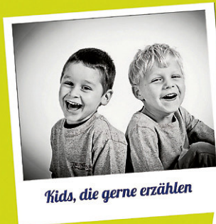
Kids, die gerne erzählen

jeden 1. Dienstag im Monat Gemeindebücherei Forst