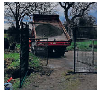
Das neue Tor

In dieser Woche freuen wir uns sehr über die Montage des neuen Tores auf dem Gelände des ForJu. Vielen Dank an die Kollegen vom Bauhof, die bei Regen und Sturm das neue Tor eingebaut haben und regelmäßig für kleine und mittelgroße Renovierungsarbeiten für uns da sind.