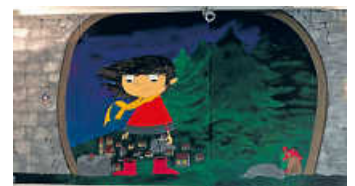
Dieses Wandbild ist in und nach den Faschingsferien als gemeinsames Kunstprojekt entstanden

Wir laden ein am Dienstag, 21.03.2023, um 15.30 Uhr, zum Osterbasteln im Jugendhaus für Kinder und Jugendliche ab 8 Jahren. Materialien werden gestellt. Wer sich einen Platz sichern möchte, der kann sich vorab anmelden unter Jugendhaus@Forst-baden.de . Die Teilnehmerzahl ist begrenzt.