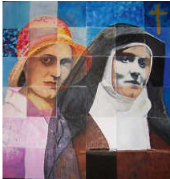
Porträt Edith Stein, Studierende der KPH Edith Stein, Österreich

Aufbrechen, sich neu finden, Vertrauen wagen mit Edith Stein