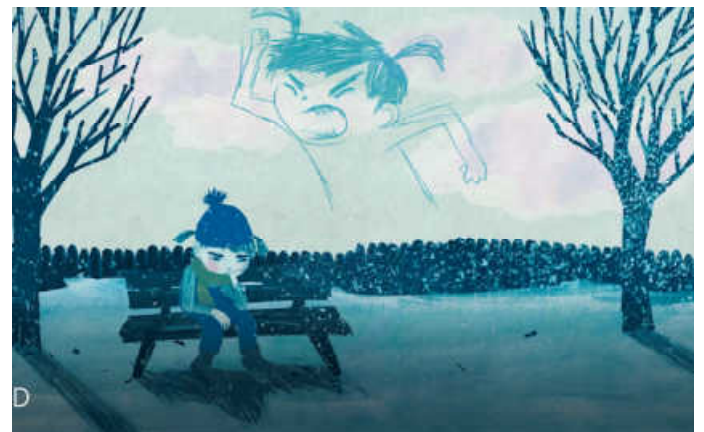
Szene aus dem Film