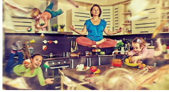
Kindertagespflegeperson schwebt im Yogasitz mit Kindern über eine Küche

Weitere Gesprächstermine können nach Vereinbarung, gerne auch zu anderen Zeiten, angeboten werden.