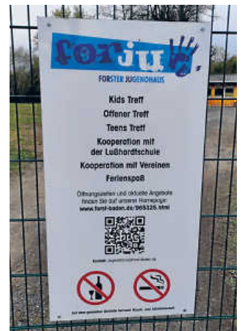
Das neue Schild am Tor mit QR-Code zum scannen

Langsam laufen die Vorbereitungen zum Tag der offenen Tür, da werden sich alle, die sich auf dem Gelände aufhalten, mit einer kleinen Aktion beteiligen. Es wird echte Panzer zu besichtigen geben, wir wagen einen Zeiteinsatz ins Mittelalter mit der Eisernen Garde und stärken uns bei Leckereien vom Waldkindergarten und vom Jugendgemeinderat u.v.m.