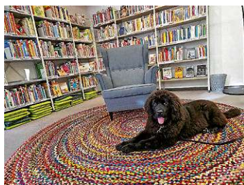
Hundemädchen Lizzy, die gerne zuhört

Einfach vorbeikommen – Platz nehmen – erzählen!