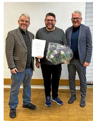
Jubiläum