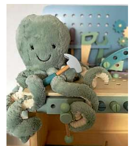
Grüne Krake sitzt mit Hammer vor einer Werkbank

Zudem informieren wir Sie bei Interesse gerne über die Tätigkeit als Kindertagespflegeperson, welche Voraussetzungen dafür notwendig sind und über die Qualifizierung.