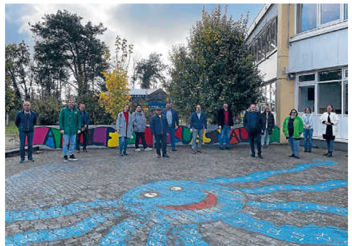
Das Bild zeigt einen Teil der Klausurteilnehmer beim Besuch einer teilgebundenen Ganztagsgrundschule in der Region

- und allgemeine Prioritätensetzungen für die nächste Zeit.