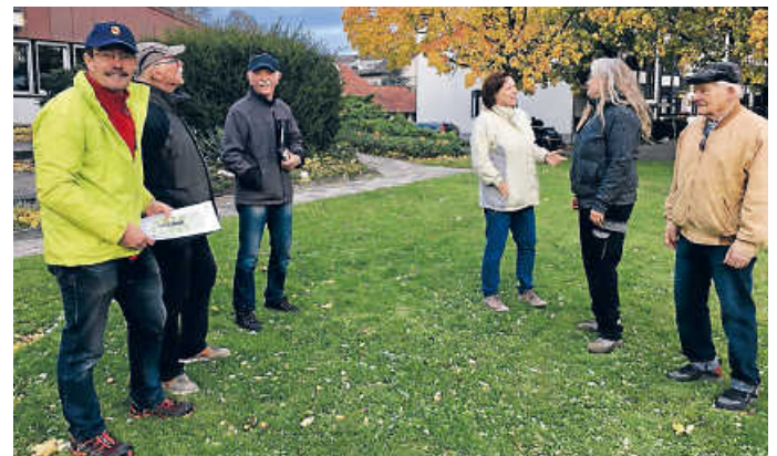
Naturschützer beraten die Ortsältesten