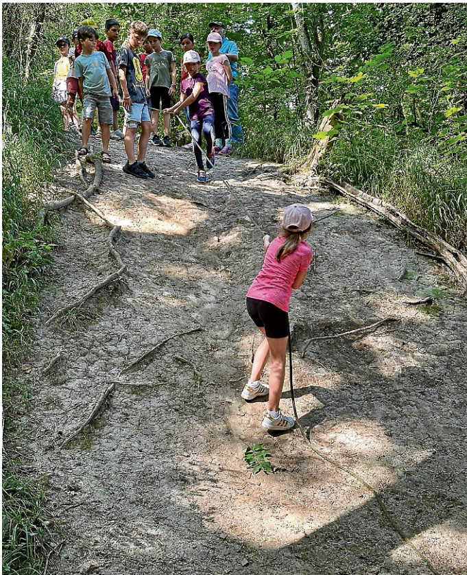
Abseilen in Schlucht