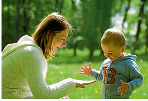
Frau hält Jungen die Hand hin